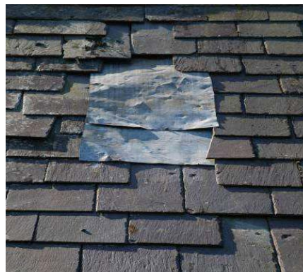
Herstel leiwerk conform bestaande toestand: vergunningvrij