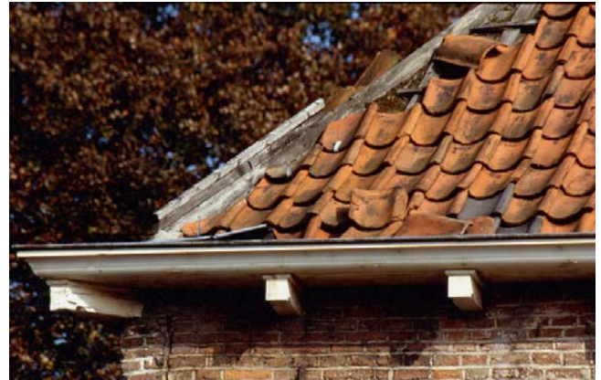
Herstel lood en pannen conform bestaande toestand: vergunningvrij