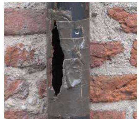
Kapotte delen van de hemelwaterafvoer met hetzelfde materiaal vervangen: vergunningvrij