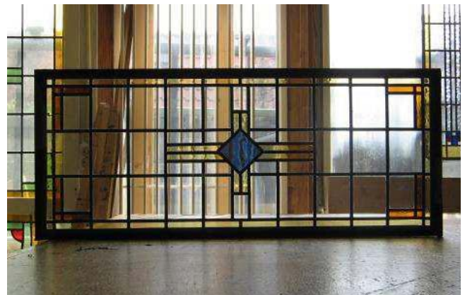
Glas-in-loodraam uitgenomen, hersteld en met dezelfde glassoort teruggeplaatst: vergunningvrij